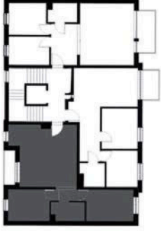
SCHEMAT KONDYGNACJI 2 BUDYNKU NR 6