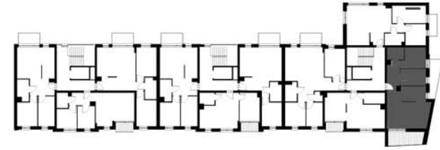
SCHEMAT KONDYGNACJI 3 BUDYNKU G