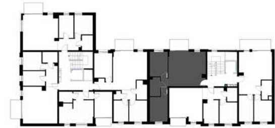
SCHEMAT KONDYGNACJI 4 BUDYNKU F