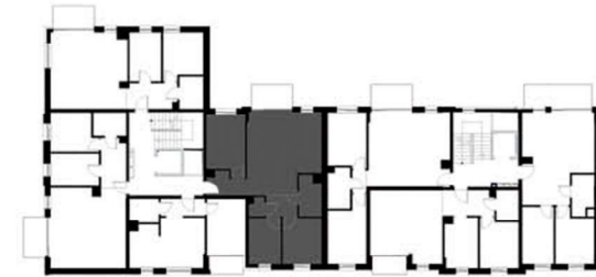
SCHEMAT KONDYGNACJI 4 BUDYNKU F