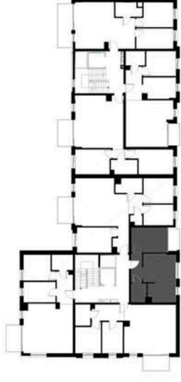
SCHEMAT KONDYGNACJI 4 BUDYNKU NR 2