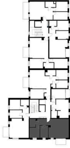
SCHEMAT KONDYGNACJI 3 BUDYNKU NR 2