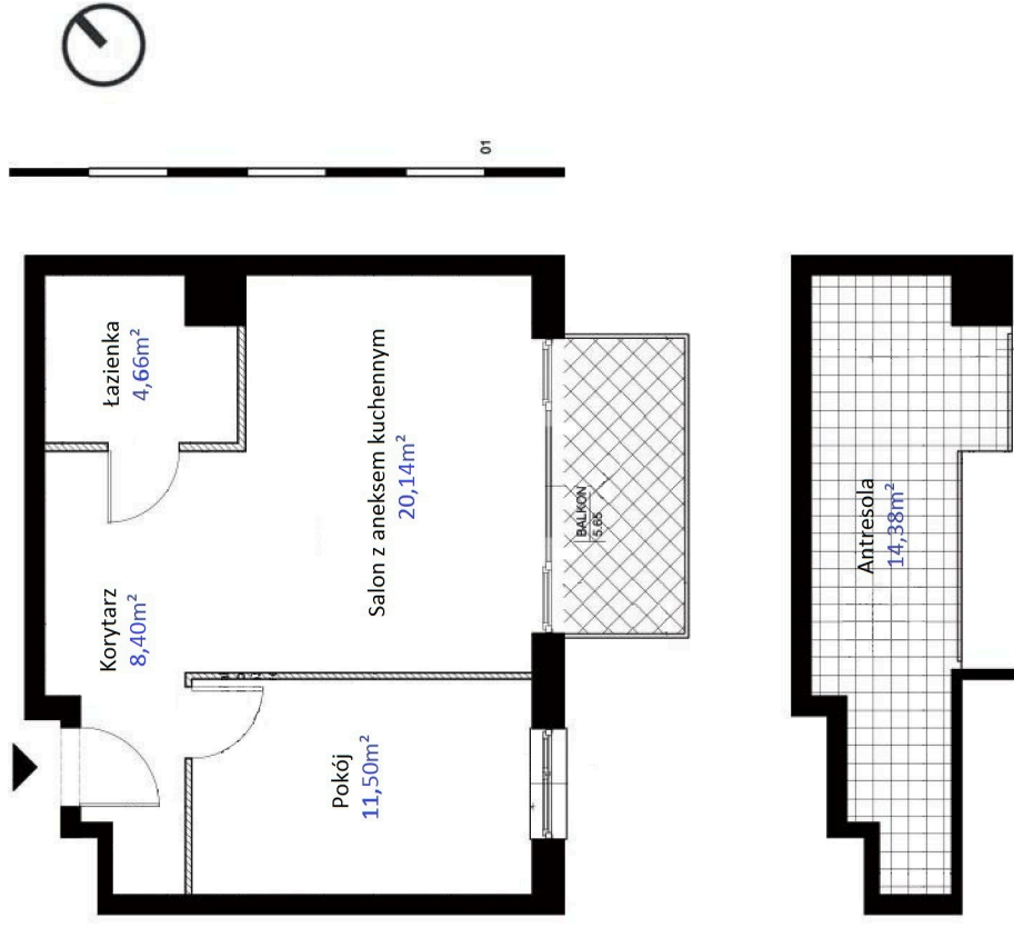
SCHEMAT KONDYGNACJI IV BUDYNKU NR. 8A