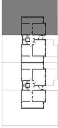
SCHEMAT KONDYGNACJI I BUDYNKU NR 8A