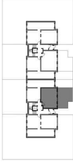
SCHEMAT KONDYGNACJI I BUDYNKU NR 8