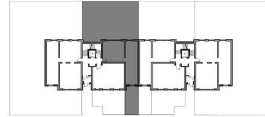
SCHEMAT KONDYGNACJI I BUDYNKU E